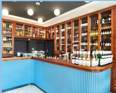
ILAVA - PREDAJŇA

ALKO - NEALKO PIVO - VÍNO TABAKOVÉ VÝROBKY DOPLNKOVÝ SORTIMENT