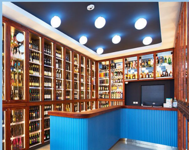
PÚCHOV - PREDAJŇA