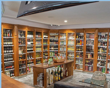
TRENČÍN - SKLAD - PREDAJŇA